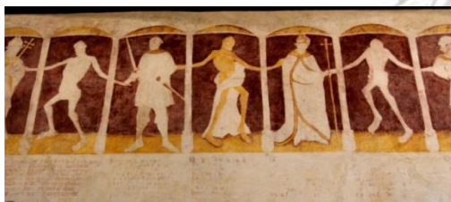
Kermaria an Iskuit