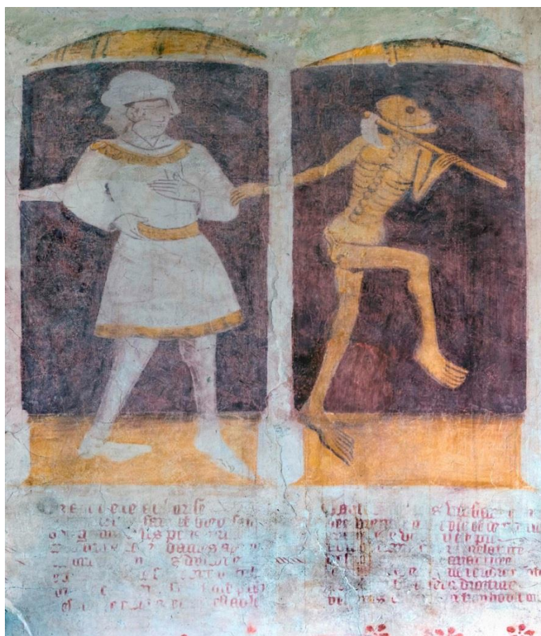
Danse macabre de Kermaria an Iskuit

Brest, Université de Bretagne Occidentale