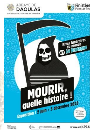
Affiche de l'exposition de Daoulas

17h00-18h15 : présentation des livres sur la mort à la Médiathèque François Mitterrand, 25 rue de Pontaniou